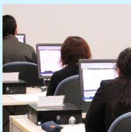
PCデスクは1人1台用意

※受講料は無料です。但しテキスト代として15,000円(税込)は自己負担となります。