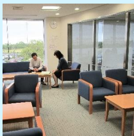
休憩可能なフリースペース

入学願書は住居を管轄するハローワークに提出してください。受験票は発行しませんので、選考日時等に留意してください。(応募締め切り前日までに求職申込と職業相談が必要です)