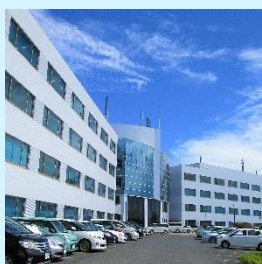
ひたちなかテクノセンター

事務職にかかせないOA操作についてOS基本操作からOffice系ソフトまでを体系的に学びMOS試験の合格を目指します。さらに事務職基礎知識(総務事務と社会保険の基礎)及び、Excelに関しては、基礎からマクロ・ExcelVBA(Excelプログラミング基礎)までを学習し「OA事務エキスパート」人材を目指します。