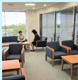
休憩可能なフリースペース