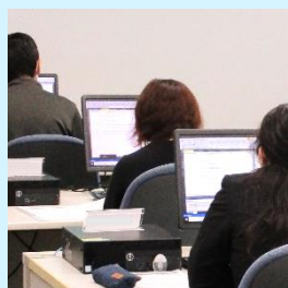
PCデスクは1人1台用意